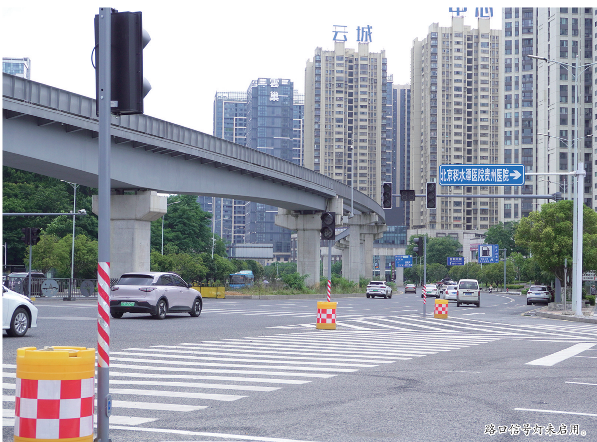
路口信号灯未启用。

近日,有市民向媒体反映,在贵阳市白云区数博大道云博路与金融西路十字路口处,这里已安装好信号灯,但是一直未见启用,再加上路中的隔离护栏未开口,导致市民无法过马路,希望媒体进行关注。