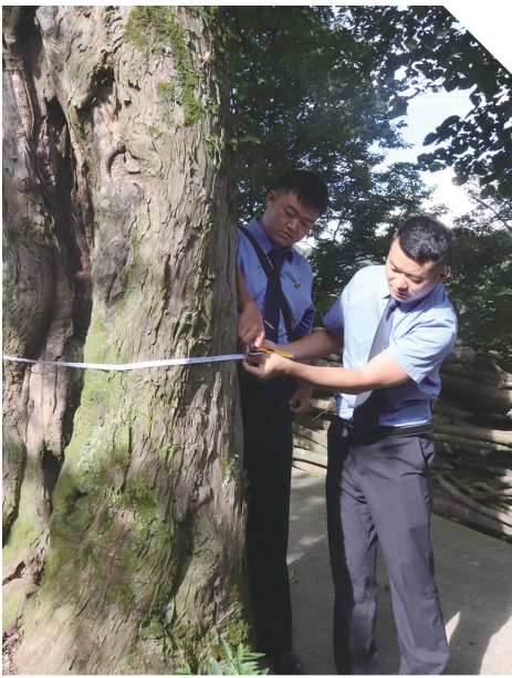
梵净山生态检察官调查现场。

该院摒弃“就案办案”思维,将生态环境保护检察工作置于筑牢长江上游生态屏障、服务铜仁市打造梵净山世界旅游目的地战略全局中谋划。通过组建“梵净山生态检察官”办案团队,以梵净山生态和红色文化为两翼,以“三棵千年名木古树”保护为主线,将生态优先、绿色发展理念融入检察履职全过程,以“梵净山生态检察官”品牌为引领,当好梵净山世界自然遗产地的司法守护者。