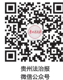
贵州法治报 微信公众号