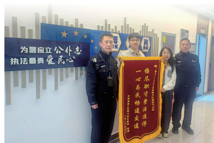
观山湖交警获赠锦旗。