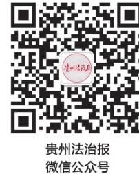
贵州法治报 微信公众号