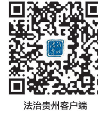
贵州法治报 微信公众号