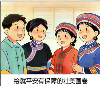
绘就平安有保障的壮美画卷