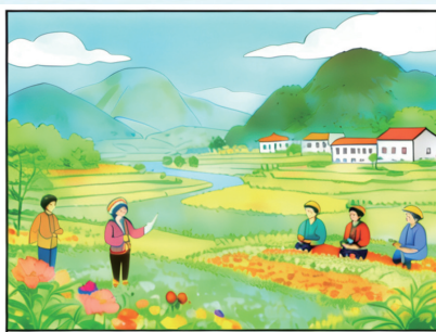
平安是各族群众最朴素的期盼

在矛盾纠纷化解方面,随着“平安守护人”主动参与排查化解,推动矛盾纠纷源头治理,罗甸“321+N”、平塘“1+14+N”等解纷模式亮点纷呈,福泉“金兰娘调解室”、三都“绣娘调解室”等特色品牌深入人心,全州96%以上矛盾纠纷在镇村层面化解,实现了“小事不出村、大事不出乡、矛盾不上交”。