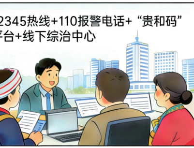
多元渠道参与治理