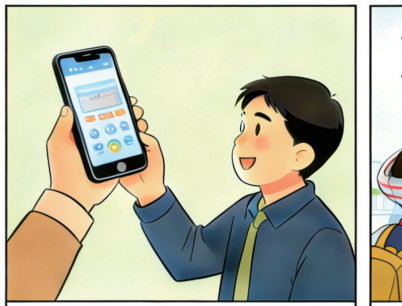
群众足不出户就能传递线索