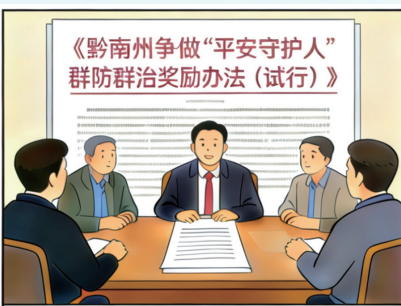
2月14日,黔南州出台奖励办法