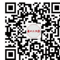
贵州法治报 微信公众号