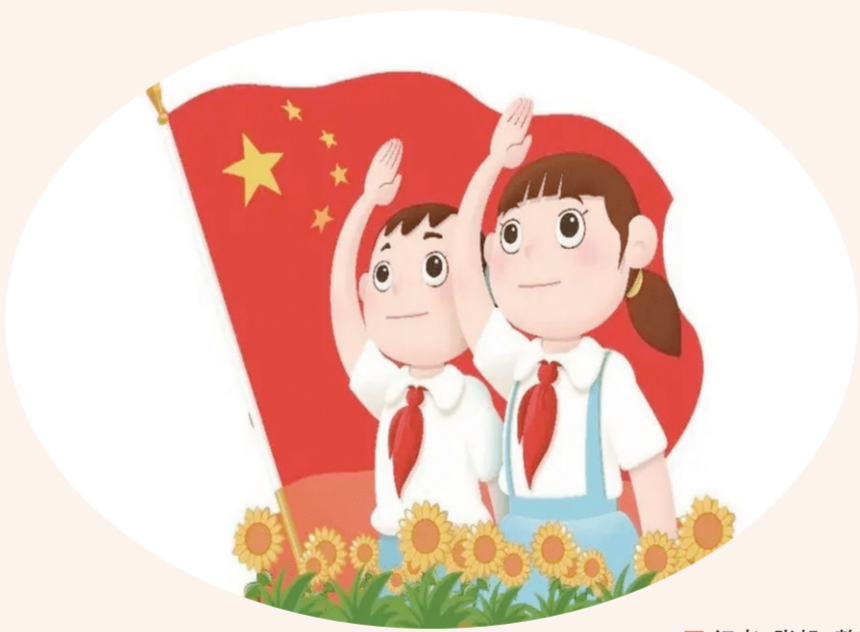
记者 张帆 整理

草案对侮辱国歌、国旗、国徽,歪曲、丑化、亵渎、否定英烈事迹和精神等违背爱国主义精神的禁止性行为及其法律责任作出规定。草案的规定突出了文艺作品评选、理论研究和先进表彰等工作的爱国主义导向,有利于在全社会进一步弘扬爱国主义精神和社会主义核心价值观。草案的相关规定与现行法律相衔接,对于进一步落实宪法有关规定、维护宪法和法律权威具有重要意义,是弘扬爱国主义精神的重要法治保障。